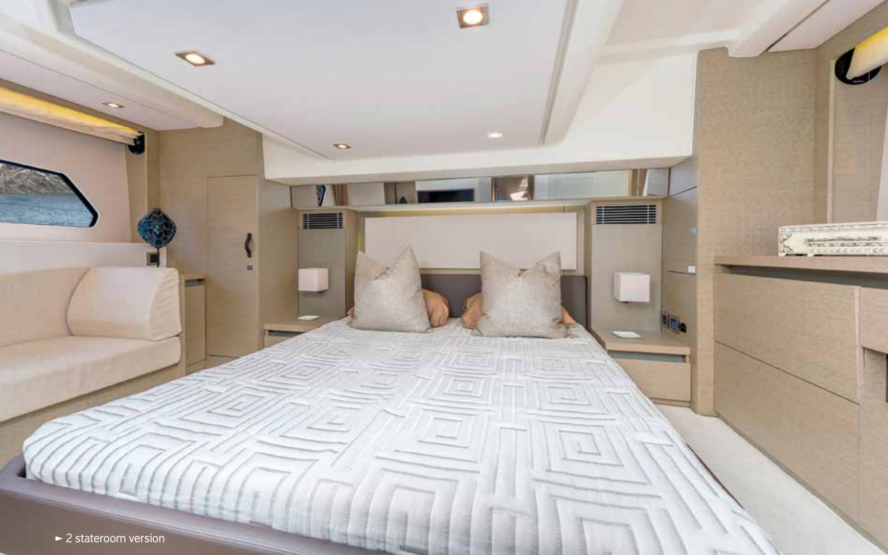
► 2 stateroom version