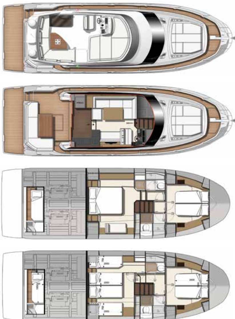
Model available with 2 or 3 staterooms

Connected boat technology. Equipped with searapps CONNECT YOUR BOAT FREE YOUR MIND