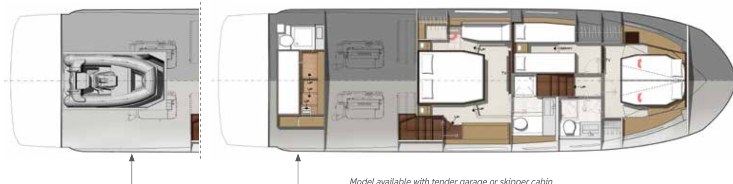
Model available with tender garage or skipper cabin